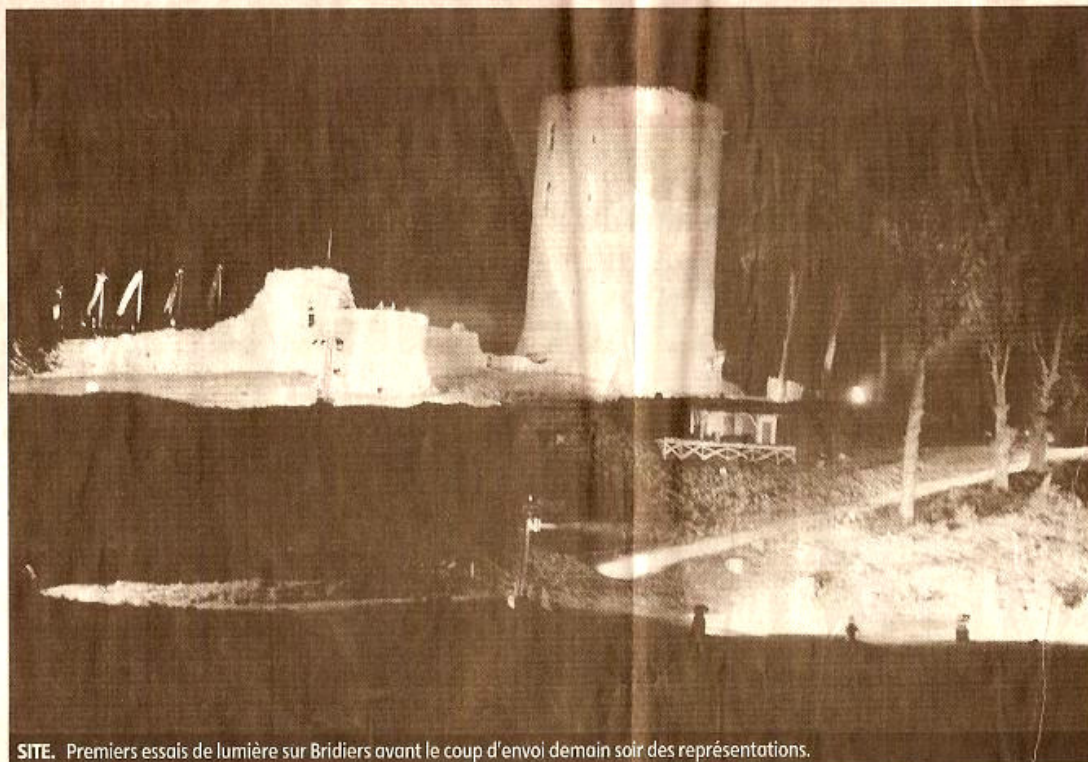
SITE. Premiers essais de lumière sur Bridiers avant le coup d'envoi demain soir des représentations.